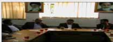
در این شماره می‌خوانیم: