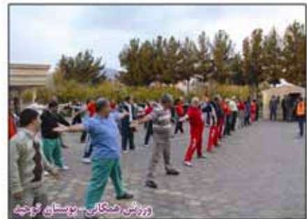
ورزش همگانی - بوستان نوحیه

۲۷ زمین بلا استفاده در محلات مختلف سطح شهر به ورزشهای همگانی اختصاص یافت ، شهرداری بیرجند با شناسایی ، خاک برداری ، فنس کشی و تجهیز این زمینها ، فضایی مناسب جهت ورزش جوانان فراهم کرد.