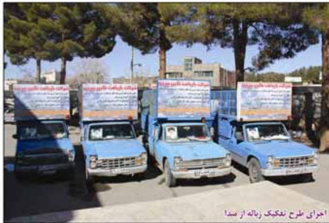
اجرای طرح تفکیک زباله از سدا

انجام طرح جامع مطالعاتی مدیریت پسماند و ورود بخش خصوصی در اجرای طرح تفکیک زباله از مبدا پروژه هایی است که تحول در حوزه جمع آوری زباله ای شهر بیرجند را به همراه خواهد داشت. خدمات ایمنی شهرداری نیز با کلنگ زنی یک واحد ایستگاه آتش نشانی ،خرید دو دستگاه خودروی اطفاء