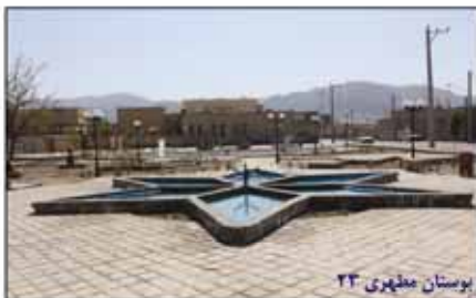
بوستان مطهری ۲۳

احداث بوستان مطهری ۲۳، احداث بوستان خیابان شهید آوینی، احداث بوستان دولت، احداث بوستان خیابان خلیل طهماسبی، بهسازی بوستان شقایق، احداث بوستان محله ای انقلاب ۱۰ اجرای فضای سبز خیابان مصطفی خمینی (ره) و ساماندهی میدانی مادر، قدس و امام از مهمترین پروژه های اجرا شده در حوزه فضای سبز بود. اجرای شبکه آبرسانی چاههای گورستان و ابوذر، جداسازی آب شرب از آب فضای سبز بلوارهای شعبانیه، رجایی و شهید ناصری، احداث دو مخزن بتنی زمینی جهت ذخیره آب و اجرای عملیات لوله گذاری و آبرسانی فضای سبز مطهری نیز گامهای بزرگی در مدیریت منابع آب شهری بود که در سال گذشته در دستور کار سازمان پارکها و فضای سبز شهرداری قرار داشت.