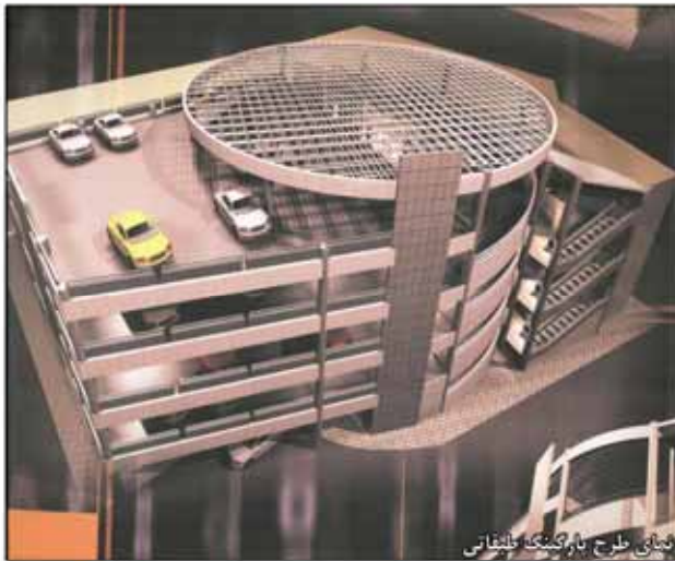
نمای طرح پارکینگ بلبلتانی

چهل میلیارد ریال هزینه اتمام تنها دو طبقه از هفت طبقه پارکینگ طبقاتی خیابان جمهوری اسلامی بوده است. پارکینگی با ظرفیت ۷۰۰ خودرو در ۷ طبقه که به طور متوسط ظرفیت هر طبقه ۱۰۰ خودرو می باشد. تامین پارکینگ معابر اصلی یکی از راهکارهای اساسی و شاید یکی از پیش زمینه های اصلی کنترل ترافیک بافت شهری است. شهرداری بیرجند در سالهای اخیر با اجرای طرحهای کارت