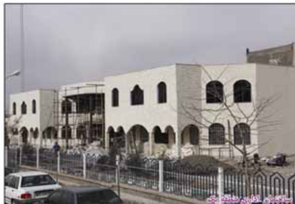
سازمان آفرین منطقه یک

بهره برداری از فاز اول پروژه بزرگ احداث پارکینگ طبقاتی خیابان جمهوری اسلامی با اعتباری بالغ بر ۴۰ میلیارد ریال، احداث ساختمان اداری منطقه یک شهرداری با زیربنای ۱۳۰۰ متر مربع و هزینه معادل ۲/۵ میلیارد ریال، اجرای بیش از ۱۴۰ هزار متر مربع آسفالت با هزینه ای معادل ۱۷ میلیارد ریال شامل ۴۰ هزار متر مربع زیرسازی و آسفالت ۲۵ هزار متر مربع روکش آسفالت، ۴۵ هزار متر مربع زیر سازی و آسفالت نوارحفریها و ۳۰ هزار متر مربع لکه گیری معابر سطح شهر و اجرای دهها عنوان پروژه دیگر کارنامه یکساله حوزه عمران شهرداری بیرجند بوده است. احداث سوله مدیریت بحران، بهسازی میدانی سطح شهر، اجرای دیوار ساحلی و کف سازی کانالهای کیوتر خان، بنگ آباد و بلوار سجاد بهسازی خانه تاریخی هنر اتمام